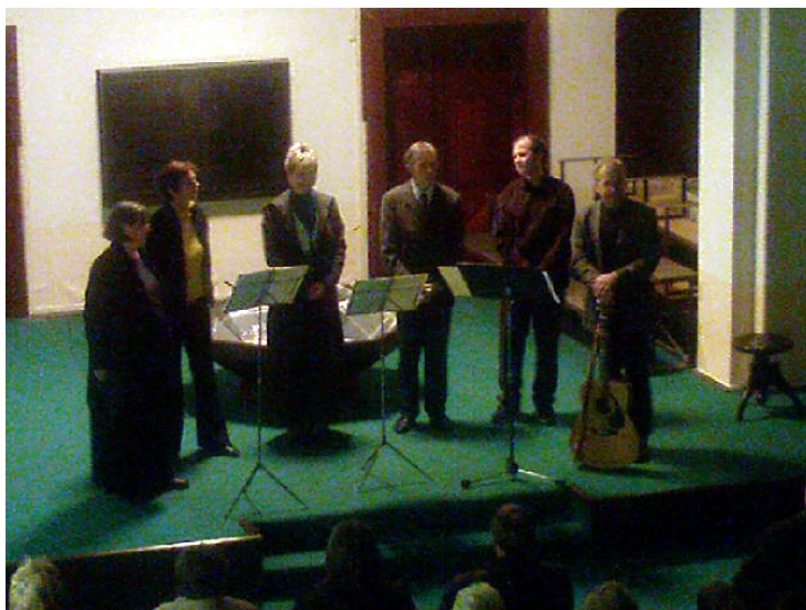
Hudební soubor De profundis, advent 2007 v Muzeu Českého granátu

Je spousta věcí, které by se ve sboru mohli díť, jedna potíž je zájem lidí, druhá finance. Ani jedna z nich nám ovšem nechce být konečnou překážkou. A často nebývá. Chci poděkovat všem, kteří do života sboru aktivně přispívají i všem, kteří ho podporují finančně. Díky.